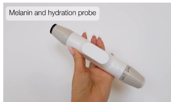
Melanin and hydration probe